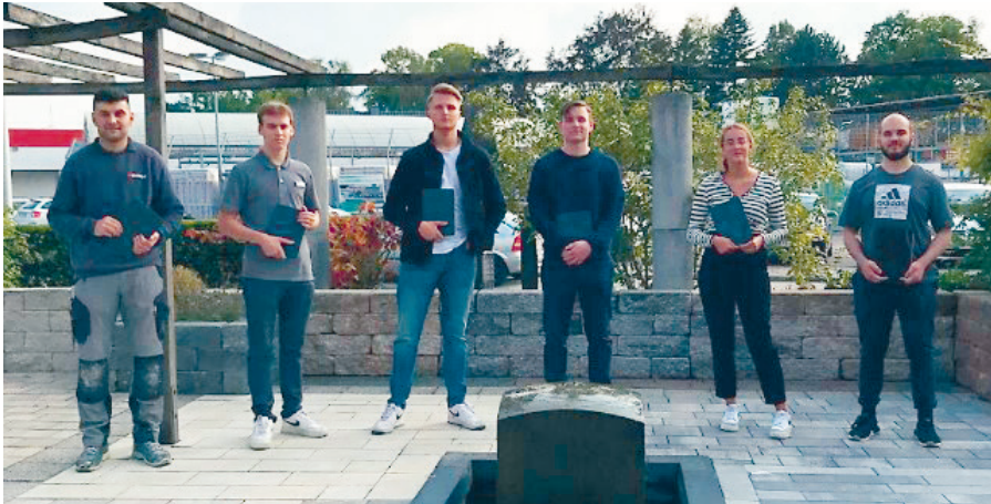
Die neuen Auszubildenden starten ausgestattet mit einem iPad die Ausbildung im Hause Nilsson.

2021 begrüßen wir wieder acht neue Auszubildende in unserem Baufachzentrum